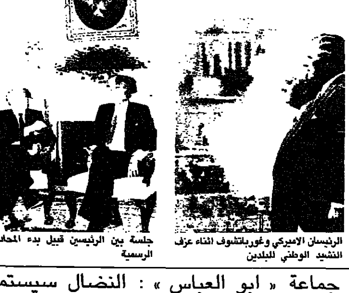
جلسة بين الرئيسين قبيل بدء المحادثات الرسمية

صرح الزعيم الفلسطيني ياسر عرفات امس، بأنه لا علاقة لمنظمة التحرير الفلسطينية بالهجوم الفدائي الذي وقع على الساحل الاسرائيلي امس الاول. وقال السيد عرفات في مؤتمر صحافي في بغداد ان منظمة التحرير غير مسؤولة عن هذه العملية ولا علاقة لها بها، واضاف قوله انه يتحدث عن المؤسسات والقوات التابعة للمنظمة رسميا. وردا على سؤال ان كان هذا يعني انه